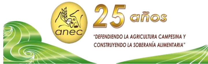
Imagen Agropecuaria / 1 octubre, 2020

https://imagenagropecuaria.com/2020/desn nutricion-sobrepeso-y-obesidad-impacta-economia-de-guatemala/